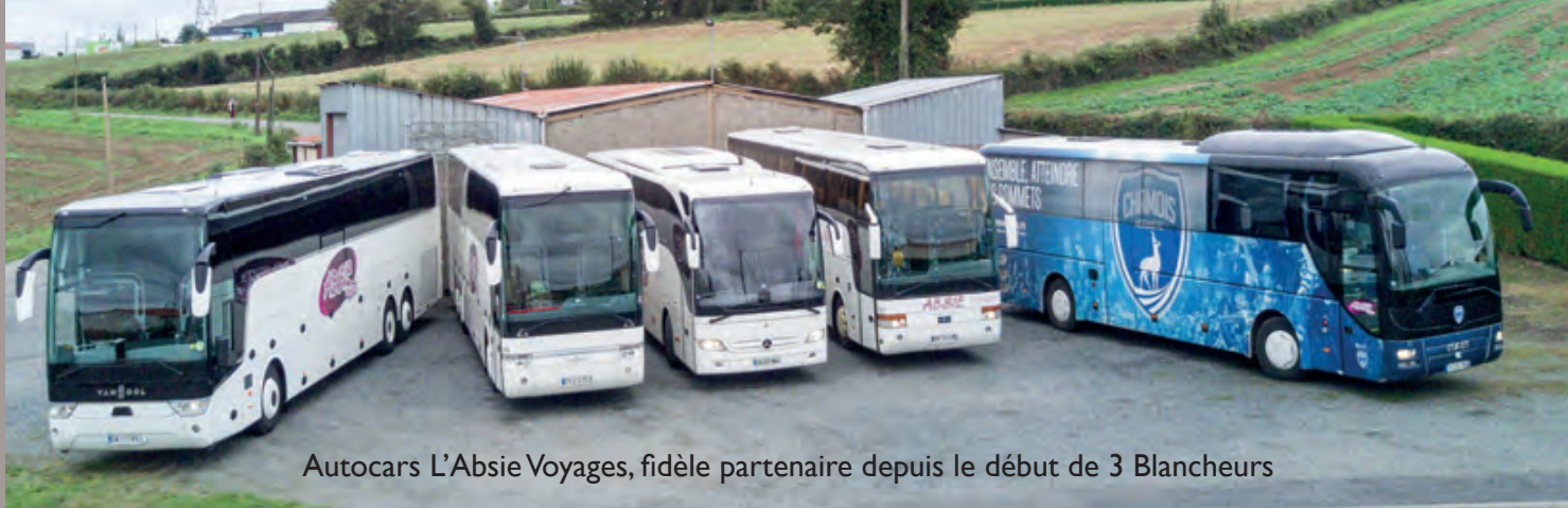
Autocars L'Absie Voyages, fidèle partenaire depuis le début de 3 Blancheurs